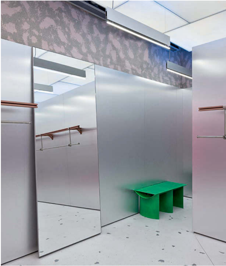
Relikte aus alter Zeit: Ein Flugzeugflügel wird zur Sitzbank, ... • An airplane wing becomes a sitting bench, ...