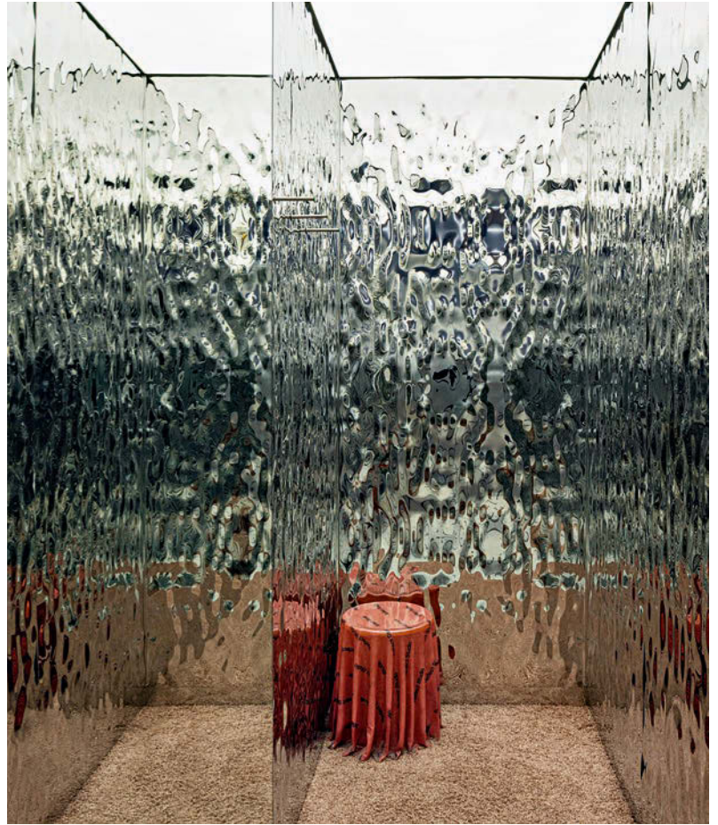
... Fast Fashion mit Harz fixiert zum „Frozen Textile Stool“. • ... Fast Fashion is turned into a "frozen textile stool".

Zwei Läden - ein Konzept: im Einkaufszentrum Kanyon befindet sich der größere der beiden futuristischen Stores. • Two stores - one concept: the larger of the two futuristic stores is located in the Kanyon shopping centre.