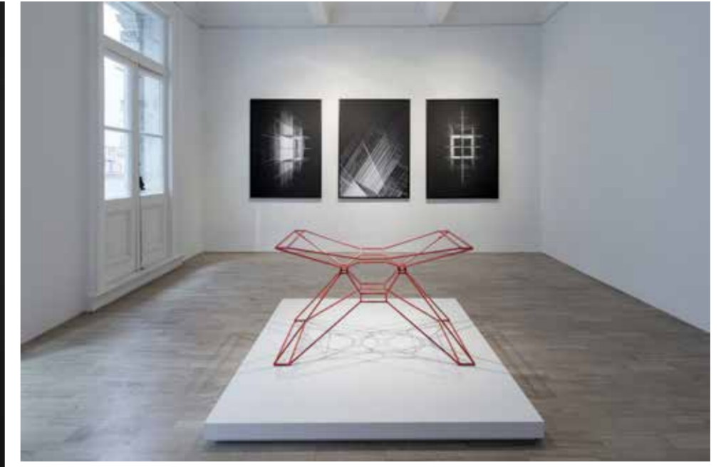
SPACEGRAPH SERGİ GÖRÜNTÜSÜ, FOTOĞRAF: KAYHAN KAYGUSUZ, VERSUS ART PROJECT İZİNİYLE