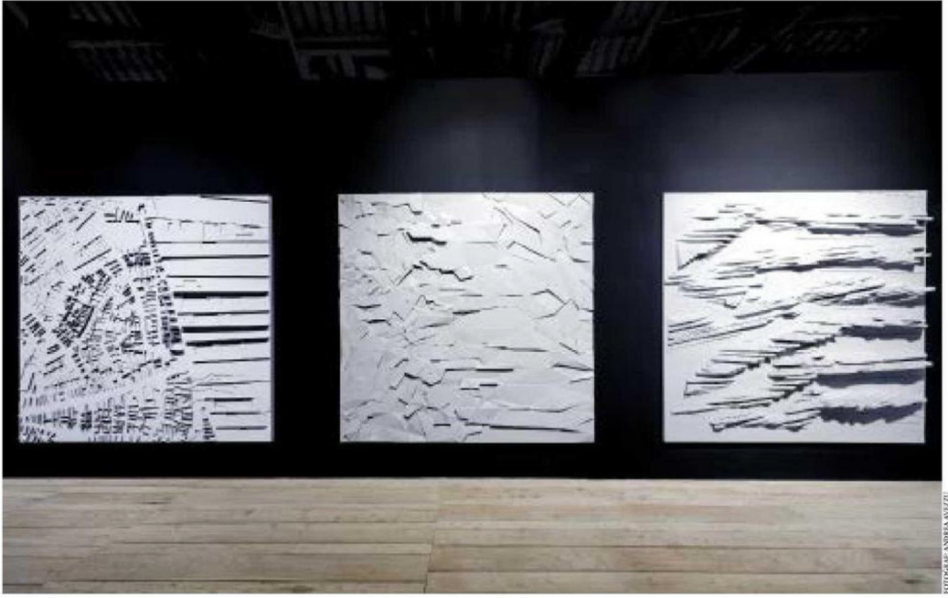
"Gelişigüzelin Metodları" sergisinde yer alan kent silüetlerinden birisi

Levent örneğinde bu kesitlerin büküm noktasına oturmuş olan kentin