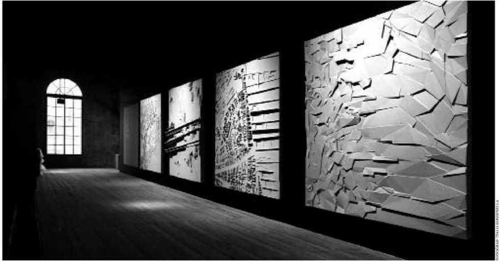
Şehrin farklı bölgelerinden topografya örnekleri

İstanbul'un halihazırda herhangi bir planlama kaygısı taşımayan, rastgele görünen yapı çevresinin ardında, görünmeyen yüzüne işlenmiş okunaklı, elzem örüntüler var. İçinden çıkılmaz görünen karmaşıklık, farklı bağlamlarda şekillenmiş ve kendi içlerinde o kadar okunaksız olmanın dokuların süper pozisyonunun bir sonucu.