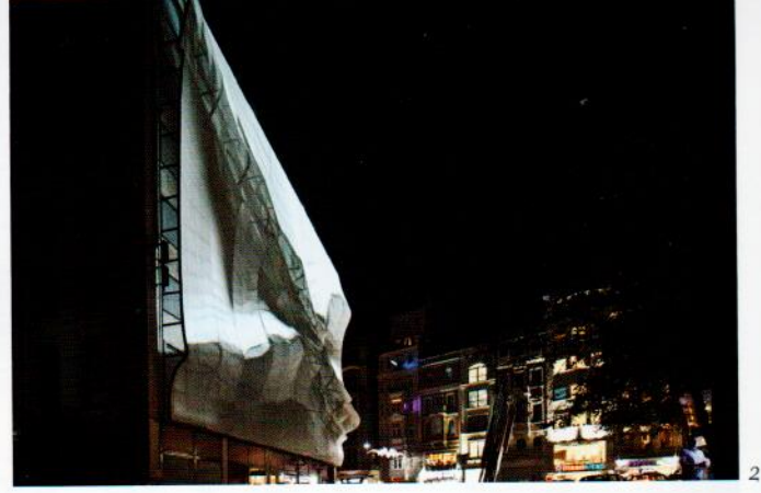
1: Bolayır Villaları 2: Wedream, Yapı Kredi 3: CTHB Projesi