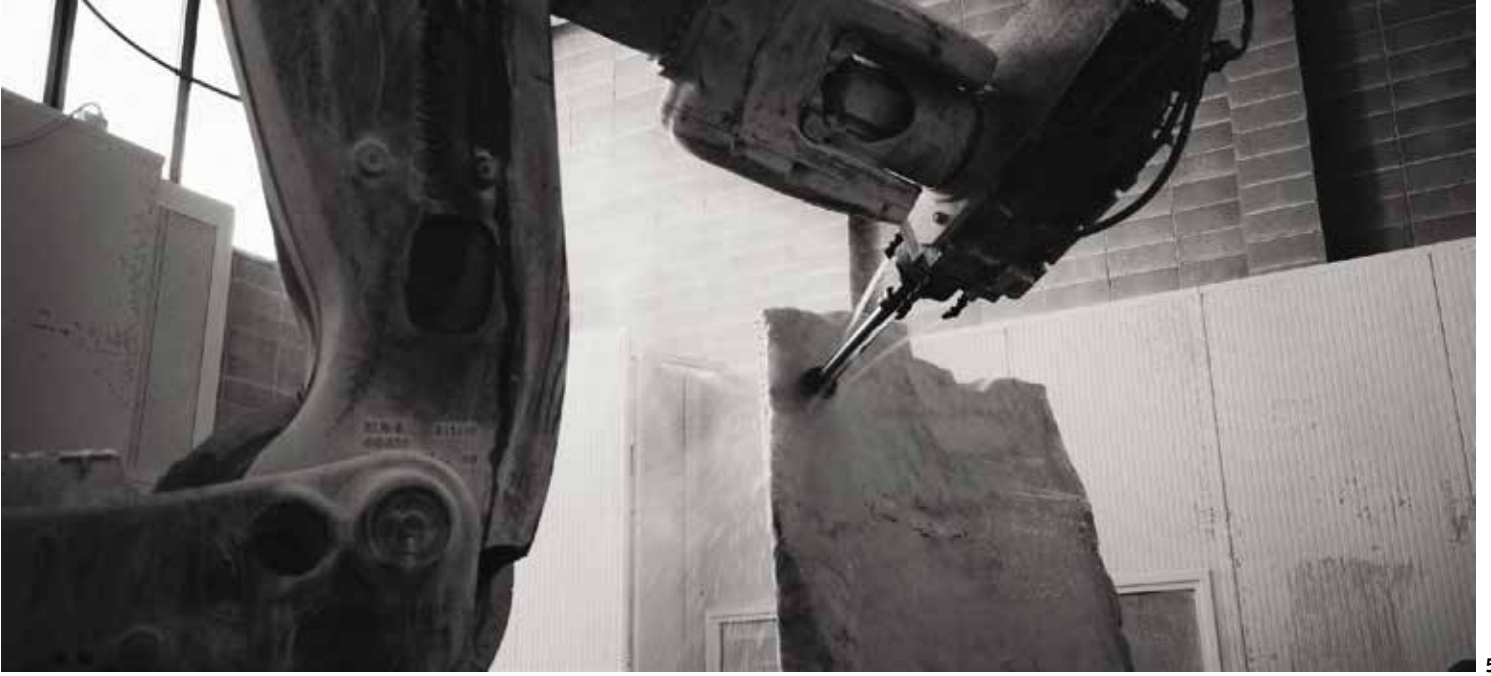
2-4 Alper Derinboğaz, "Condense", 2017 (Fotoğraf: ©Hikmet Güler). 5 Fotoğraf: ©Hikmet Güler. 6 Diyagram: ©Salon.

"Condense" yerleştirmesinde ayrıştığı nokta; günümüz dijital tasarım ve üretim teknolojilerini sunması, taşın temel kristal ve matematik morfolojilerini yansıtarak yeni formların üretilmesi. Bu noktada Derinboğaz bilimsel bir yaklaşımla, mermerin kristal formasyonunu vurguluyor ve modernist mimar Bruno Taut'un kristale olan ilgisini andıran bir yaklaşımla yeni formlar oluşturuyor. Derinboğaz, taşın temel kristal yapısını analogiden alarak, pragmatik bilim ve teknolojik üretime taşıyor. Konik taş kütleler, endüstriyel ve dijital taş kesim makinelerinin keskin geometrilerinin birer ürünü olarak karşımıza çıkıyor.